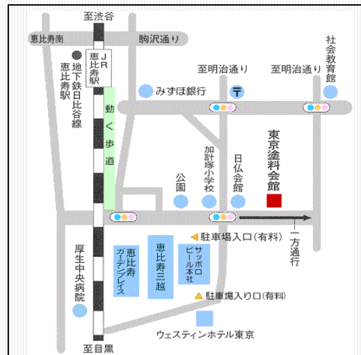
JR山手線/東京メトロ日比谷線恵比寿駅より15分。 東口より動く歩道に乗り左折、直進し左手のビル。

●会場：東京塗料会館 地下会議室 〒150-0013 東京都渋谷区恵比寿3-12-8 TEL03-3443-2011