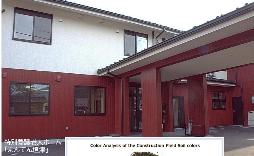
特別養護老人ホーム 「まんてん塩津」